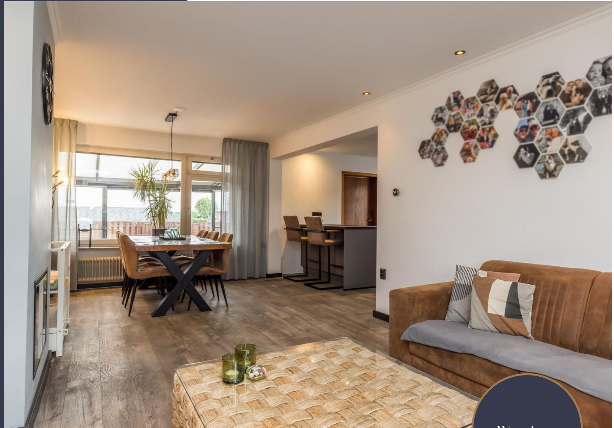
Woonkamer met open keuken

Een van de pluspunten van deze woning zijn de garages van ca. 18 en 43 m 2 . Beide garages zijn verwarmd en de grootste garage, met smeerpuit, is een droom van iedere auto-/motorliefhebber en hobbyist. De garages bieden de mogelijkheid tot het realiseren van een kantoor/praktijk aan huis of een atelier.